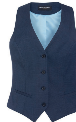
SCAPOLI - Coupe Cintrée 2334 A, C