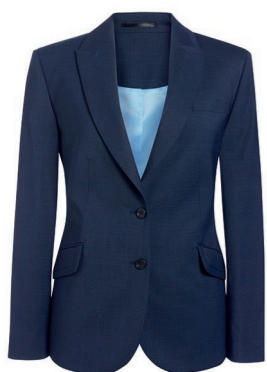
VESTE NOVARA / Page 193 COUPE CINTRÉE / A. Prince-de-galles Marine

2 boutons sur le devant, ligne d'ourlet en forme, 2 poches plaquées, fente arrière, petite poche plaquée intérieure.