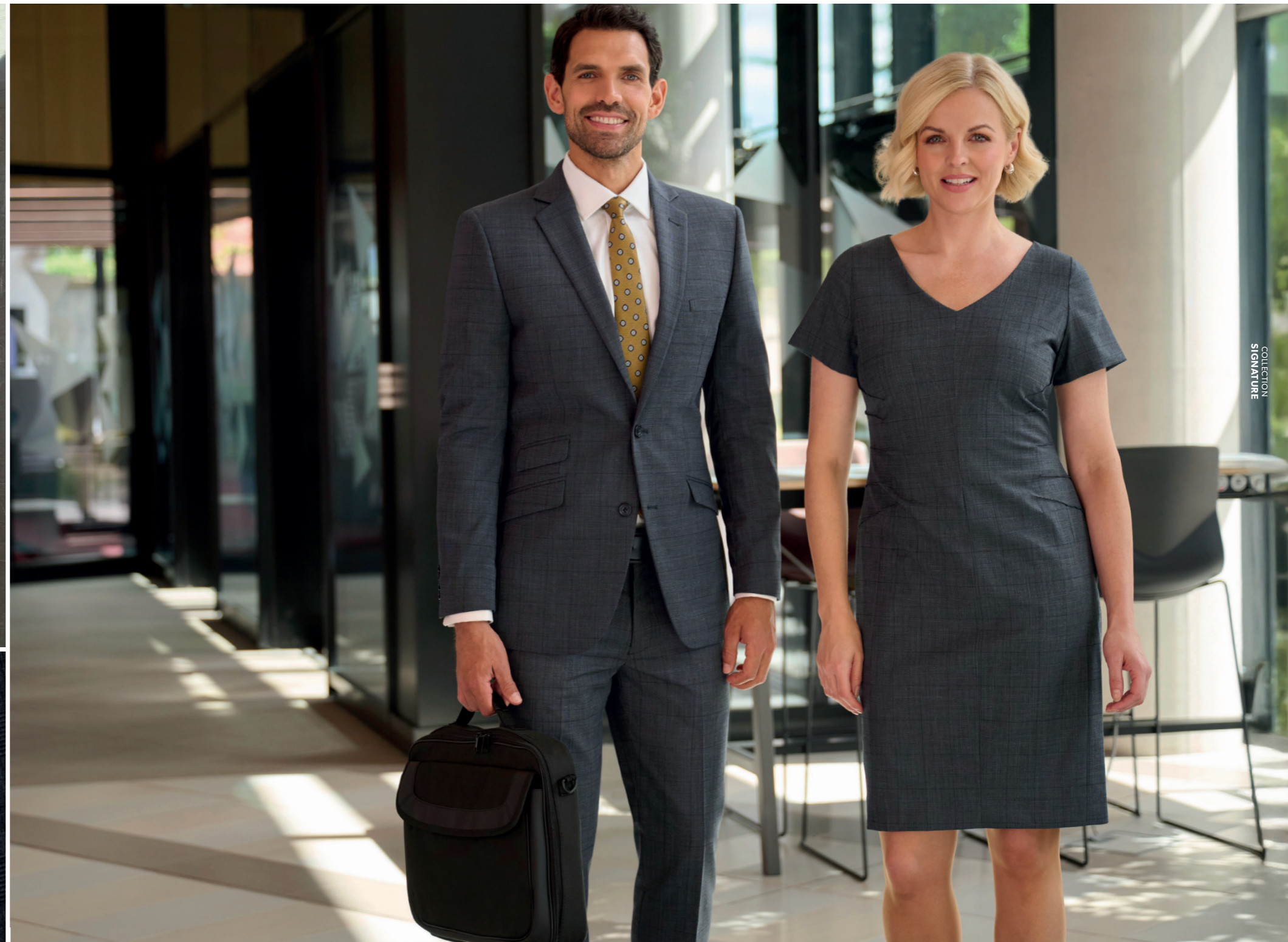
C. Prince-de-galles Anthracite