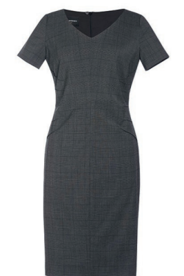
ROBE DIAMANTE / Page 194 C. Prince-de-galles Anthracite

Manches courtes, fente centrale au dos, doublure entièrement extensible, pinces à la taille, fermeture à glissière avec bouton et boucle.