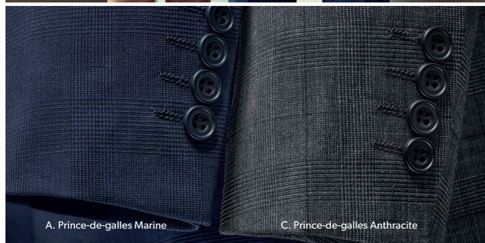
A. Prince-de-galles Marine