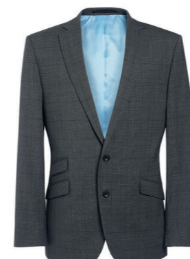
VESTE CASSINO / Page 188 COUPE SLIM / C. Prince-de-galles Anthracite

2 boutons sur le devant, revers étroits, 2 fentes à l'arrière, 2 poches plaquées, poche plaquée pour le ticket, 2 pinces sur le devant, 4 poches plaquées intérieures.