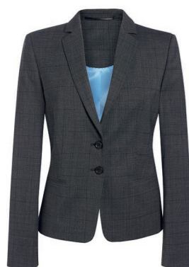
VESTE CALVI / Page 192 COUPE SLIM / C. Prince-de-galles Anthracite

2 boutons sur le devant, découpe frontale, 2 poches plaquées, dos uni, petite poche plaquée intérieure.