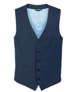
GILET BUSSO / Page 189 COUPE CINTRÉE / A. Prince-de-galles Marine

5 boutons sur le devant, dos en tissu, 2 poches passepoilées, pinces sur le devant.