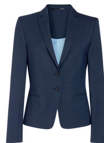
CALVI - Coupe slim 2331 A, C