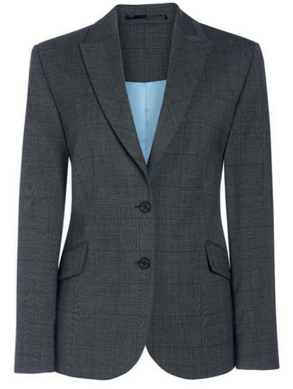
NOVARA - Coupe cintrée 2330 A, C