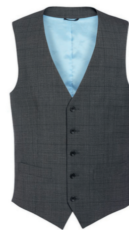
BUSO - Coupe cintrée 1540 A, C