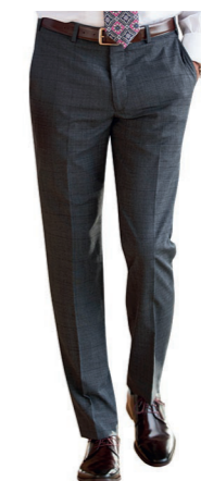
PANTALON CASSINO / Page 189 COUPE SLIM / C. Prince-de-galles Anthracite

Sans pinces, 2 poches avant, 1 poche arrière.