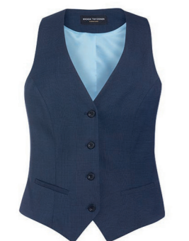
GILET SCAPOLI / Page 195 COUPE CINTRÉE / A. Prince-de-galles Marine

4 boutons, dos en tissu, 2 poches avant, fente arrière.